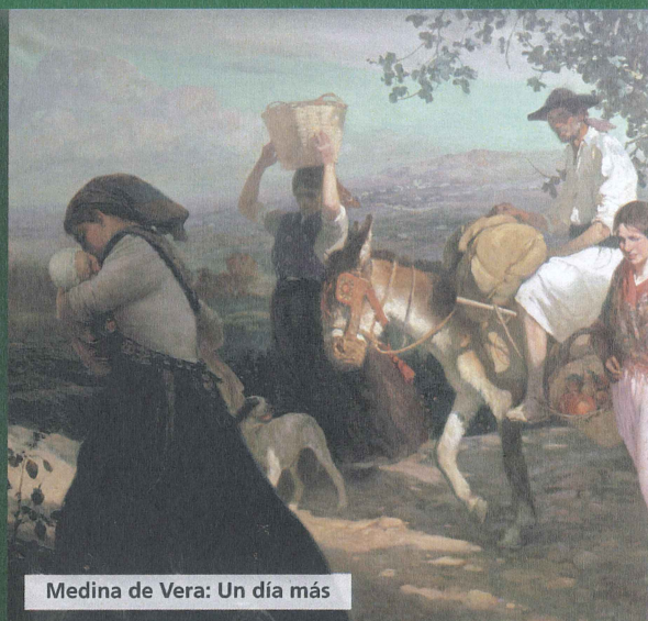
Medina de Vera: Un día más

Cuando España recuperó la democracia, Murcia se configuró como una Comunidad Autónoma uniprovincial: la Región de Murcia, con un Estatuto de Autonomía propio desde 1982.